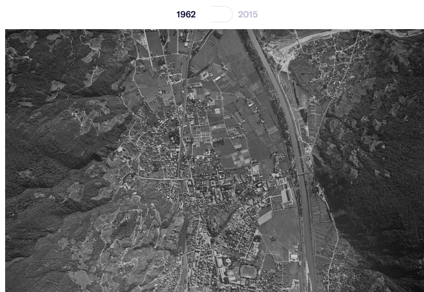
In den 1960er Jahren zählte die Stadt Bellinzona rund 16 500 Menschen. Das Umland war noch landwirtschaftlich geprägt.

Seit den 1960er Jahren ist die Tessiner Hauptstadt zur Kernstadt eines Ballungsgebietes geworden.