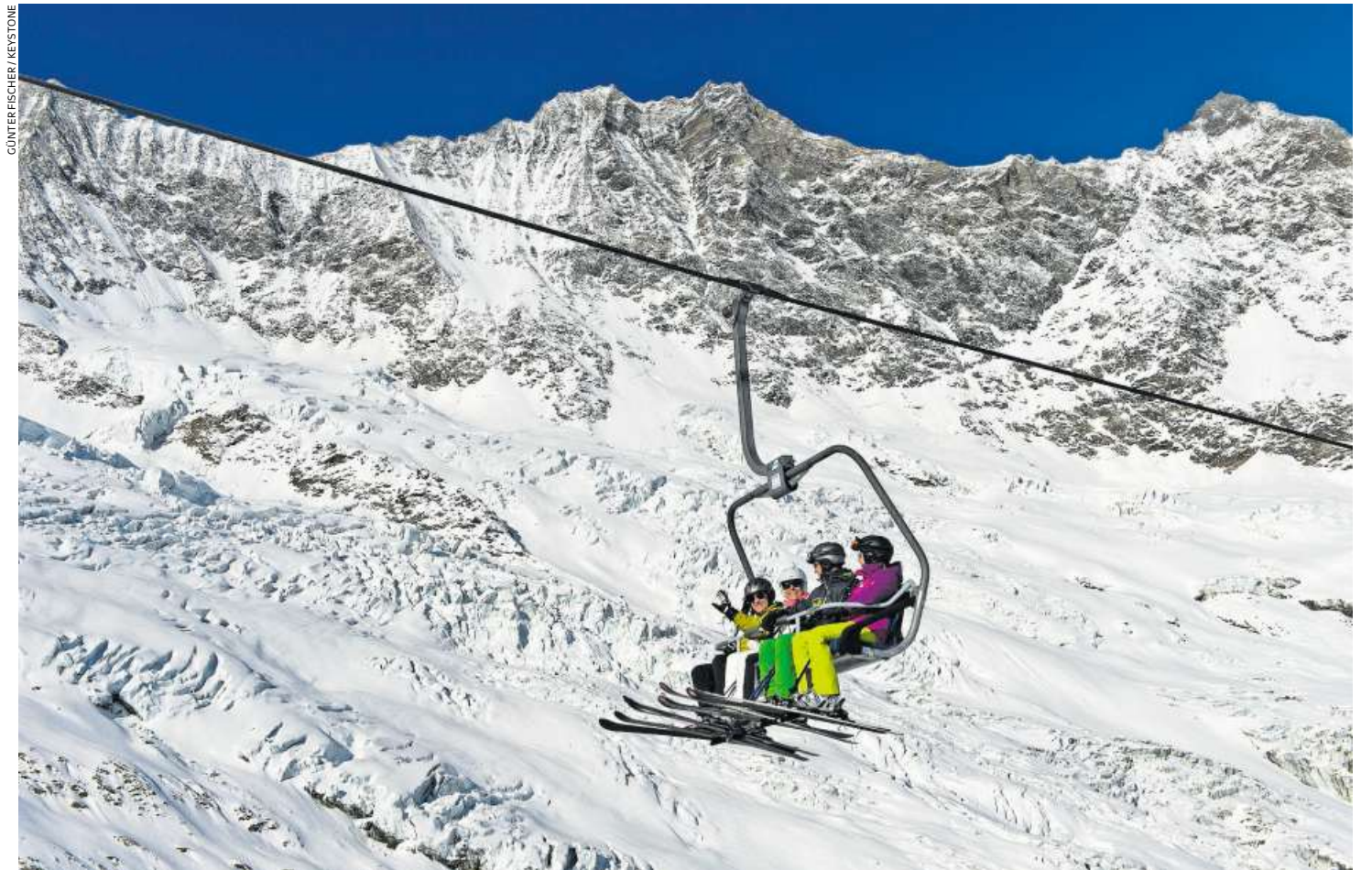
Die Saastal-Bergbahnen bieten eine günstige Saisonkarte an. Zwar kamen mehr Gäste, doch der Durchschnittsertrag sinkt.

Die Sportbahnen Vals stehen exemplarisch für zahlreiche der geschätzt 500 Bergbahnen in der Schweiz. Viele kleine und mittelgrosse Bahnen sind mehr schlecht