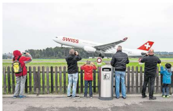
Abflug: Fachpublikum fotografiert einen Swiss-Jet. (Kloten, 1. 9. 2018)

Die Aufsichtsbehörde folgt dabei gesetzlichen Vorgaben, wonach die Flughäfen über eine gewisse Kapitalrendite hinaus nicht mehr Gebühren erheben dürfen, als für die Sicherstellung des Flugbetriebs notwendig sind. Vier Jahre nach der letzten Überprüfung will sie die offenbar übermässig rentablen Flughäfen zurückbinden. Neu sollen zur Finanzierung des Flugbetriebs verstärkt die Erträge aus dem Betrieb der Parkhäuser sowie der Shoppingcenter herangezogen werden. Noch gravierender für