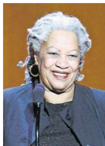
Toni Morrison ist 88-jährig gestorben.

1970 erschien ihr erster eigener Roman. «The Bluest Eye» erhielt gute Kritiken – doch erst mit ihrem dritten, 1977 erschienenen Roman «Song Of Solomon» gelang ihr der Durchbruch beim Publikum. Auf die Frage, was Literatur leisten könne, antwortete sie einmal: «Ein tschechischer Romanautor legt seine Bücher nicht so an, dass sie auf Samoa verstanden werden. Als Schriftsteller schreibt man aus der Kultur heraus, aus der man stammt. Und für diese Kultur. Trotzdem glaube ich, dass wirkliche Literatur univer-