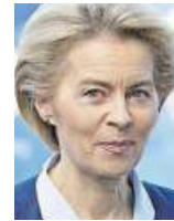
Ursula von der Leyen Präsidentin der Europäischen Kommission

Der europäische «Grüne Deal» ist Europas Antwort auf die Forderungen unserer Bürgerinnen und Bürger. Es ist ein Deal von Europa für Europa und ein Beitrag zu einer besseren Welt. Jede Europäerin und jeder Europäer kann Teil dieses Wandels sein.